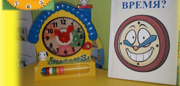
Часы и время