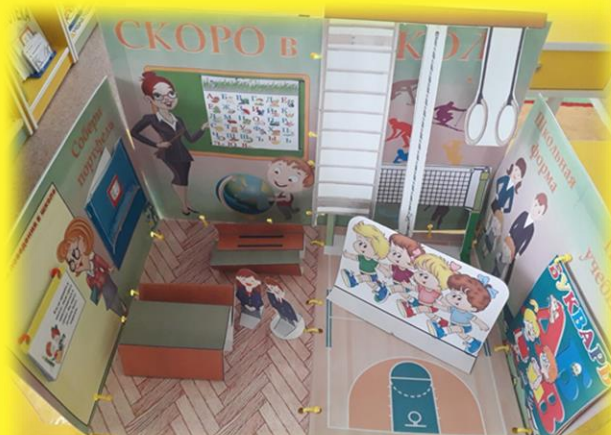
Лепбук «Я будущий первокласник»