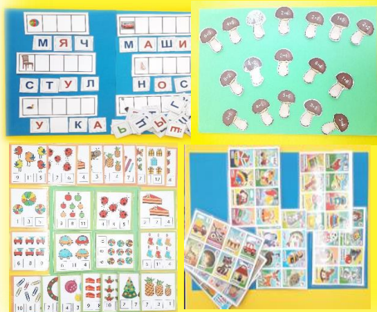
Готовимся к школе