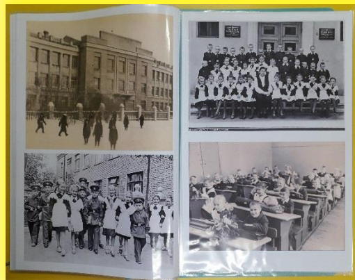
Старая и новая школа